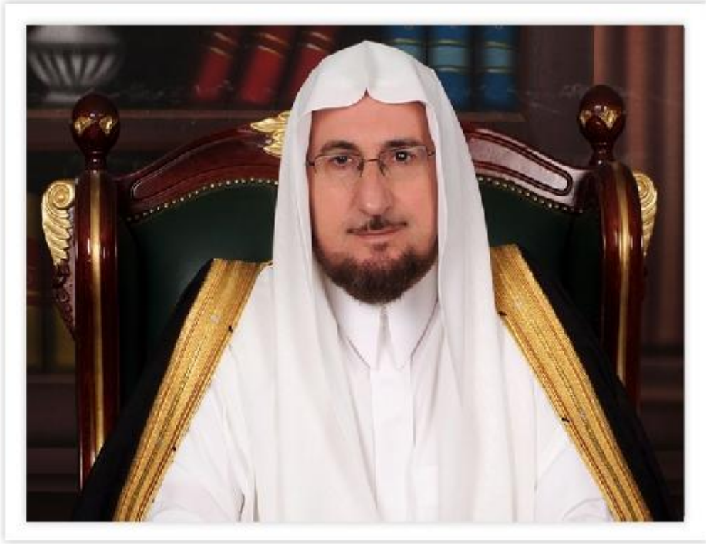
أ.د. عبدالكريم بكار