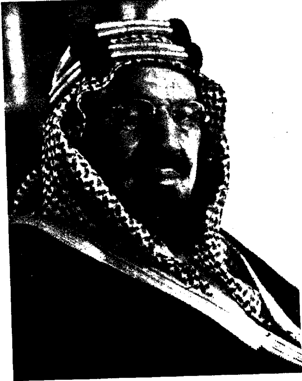
الملك عبد العزيز، تغمده الله برحمته