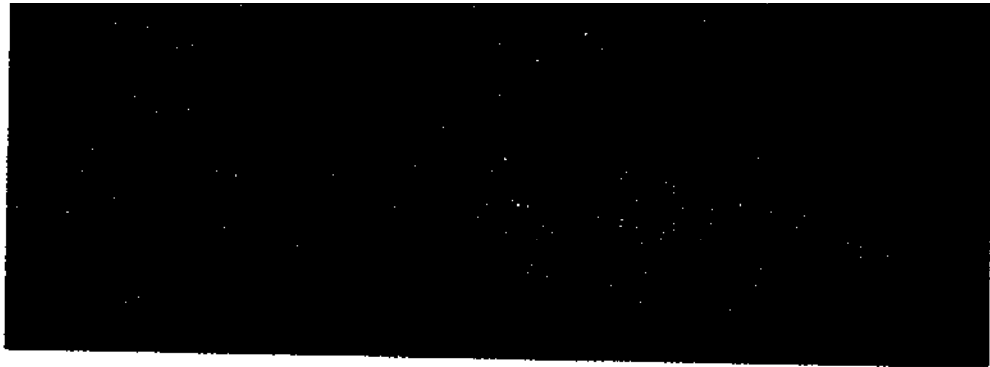
حفول الأرز في الهفوف

لم تكن محاربة الأتراك خبرة جديدة بالنسبة إلى ابن سعود، ذلك أنه كان قد لاقى، مرة بعد أخرى، فصائل تركية، وبخاصة مدفعية الميدان، ضمن جيوش ابن الرشيد، ولكن الهجوم على الأحساء، التي كان يحكمها الأتراك مباشرة، كان شيئاً آخر مختلفاً تماماً، ذلك أنه يجعله يصطدم بدولة عظمى وجهاً لوجه. ولكن ابن سعود لم يكن باستطاعته أن يختار، فما لم يخضع الإحساء وميناءها لسيطرته فإنه يبقى معزولاً عن العالم الخارجي دائماً، وغير قادر على أن يحصل على ما كان في أمس الحاجة إليه من الأسلحة والذخائر وكثير من ضروريات الحياة. كانت الغاية تبرر المغامرة، ولكن الخطر كان كبيراً جداً، حتى أن ابن سعود تردد طويلاً قبل أن يقوم بأي هجوم على الأحساء وعاصمتها، الهفوف. وهو لا يزال مولعاً، حتى الآن بأن يروي الظروف التي اتخذ فيها قراره النهائي.