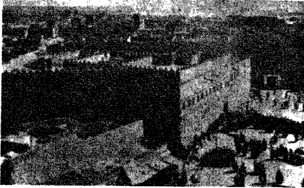
الرياض، أيام الملك عبد العزيز